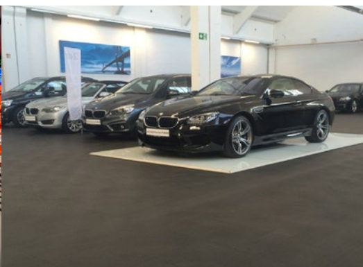
Garaże podziemne dla BMW, DE, 3000m 2