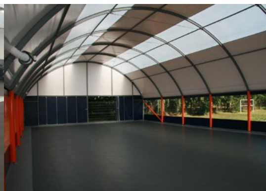
Wielofunkcyjna hala sportowa, PL, 250m 2