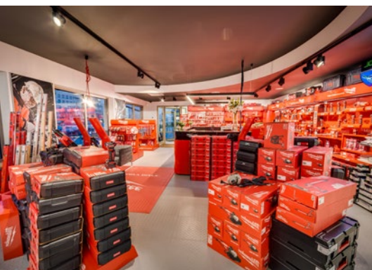
Sklep z elektronarzędziami, PL, 50m 2