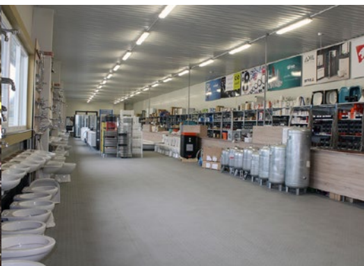
Technika grzewcza i sanitarna, CZ, 400m 2